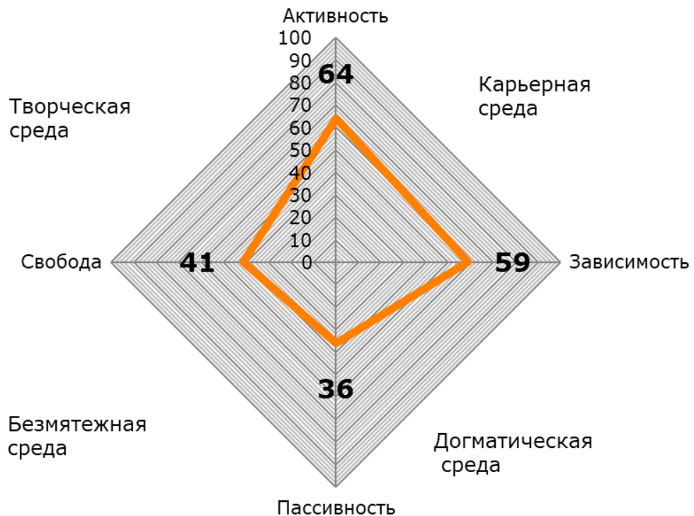
Графическая модель соотношения типов образовательной среды